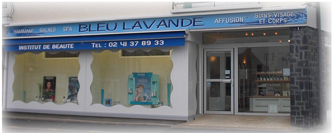
Institut Bleu Lavande